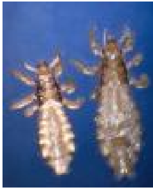
Abb. 1: Läuse

Beim Kontakt mit befallenen Personen oder Orten können diese Parasiten leicht übertragen werden. Läuse können nicht springen, sind aber gute Kletterer. Unbemerkt krabbeln sie von einem Kopf auf den andern und klammern sich mit ihren sechs kräftigen, mit Widerhaken bestückten Beinen an den Haaren fest.