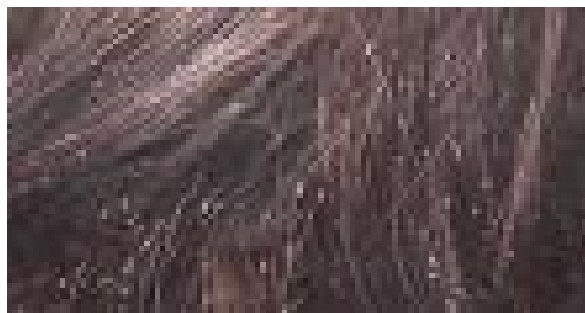
Abb. 3: Nissen